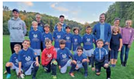
Die E-Juniorer der A08 mit ihren neuen Trikots

Die E-Juniorer der Alemannia 08 Müllheim können sich über einen neuen Trikotsatz freuen. Kürzlich fand die offizielle Übergabe,