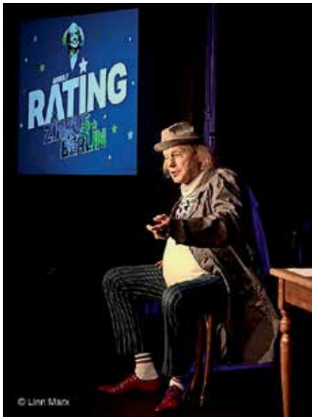
Arnulf Rating: Zirkus Berlin

Do., 10. November 2022 - 20.00 Uhr Zirkus Berlin